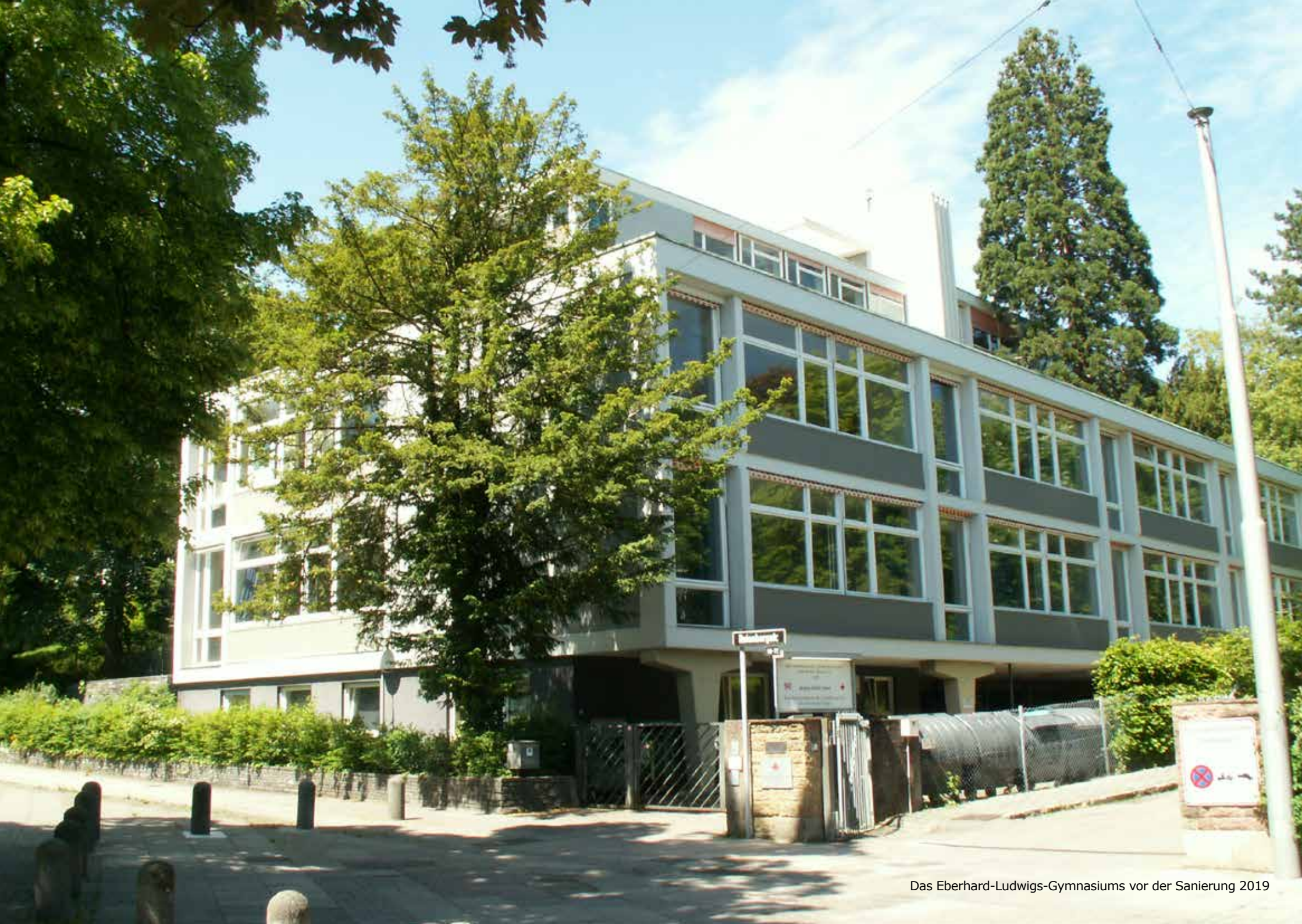
Das Eberhard-Ludwigs-Gymnasiums vor der Sanierung 2019